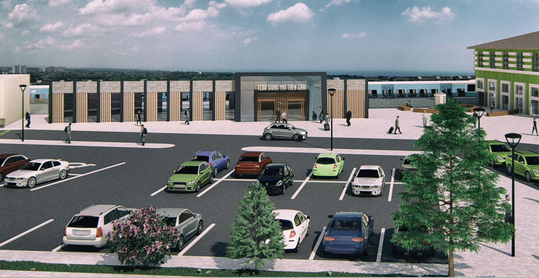
SIVAS TCDD YHT GAR BİNASI